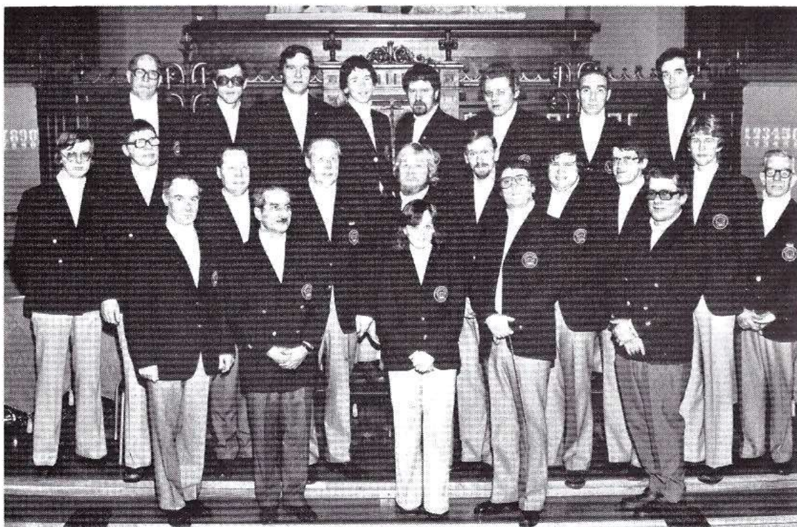
Oskarshamns Musikkår 1978

För närvarande har Oskarshamns Musikkår 26 aktiva medlemmar. Läget är ganska gott. En intensiv verksamhet försiggår varje måndagskväll på de oftast välbesökta repetitionerna. Målsättningen för programvalet är i allt väsentligt densamma nu som i Blåsorkesterns barndom: ett brett register från det gamla beprövade till den moderna populärmusiken. Vi som är medlemmar i musikkåren tycker det är roligt att musicera, och vi hoppas att vi kan dela med oss av den glädjen till vår publik.