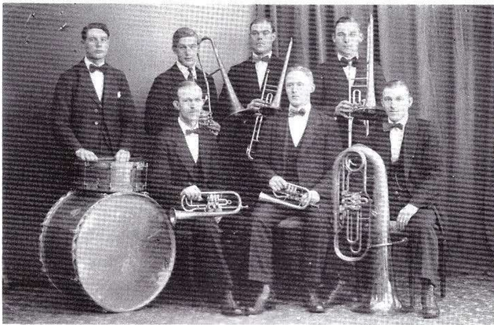
"Kamraterna" - föregångare till Oskarshamns Blåsorkester

Invigningar, hembygdsfester, demonstrationståg, kungabesök, otaliga är de tillfällen då en musikkår utgör ett naturligt, ja nästan självklart inslag i programmet. Fast det behöver inte alltid vara pompa och fest för att musikkåren skall låta höra sig. Kanske kan några jäktade snabbköpskunder stanna till och lyssna en stund på en gatukonsert en vanlig vardagskväll. Att gå ut med musiken - det är, bokstavligt talat, musikkårens uppgift. Oskarshamns musikkår har nu inlett sitt femtionde spelår och vid ett sådant jubileum känns det angeläget att blicka tillbaka och försöka kasta lite ljus över de förhållanden som rådde när den nya musikkåren bildades år 1928.